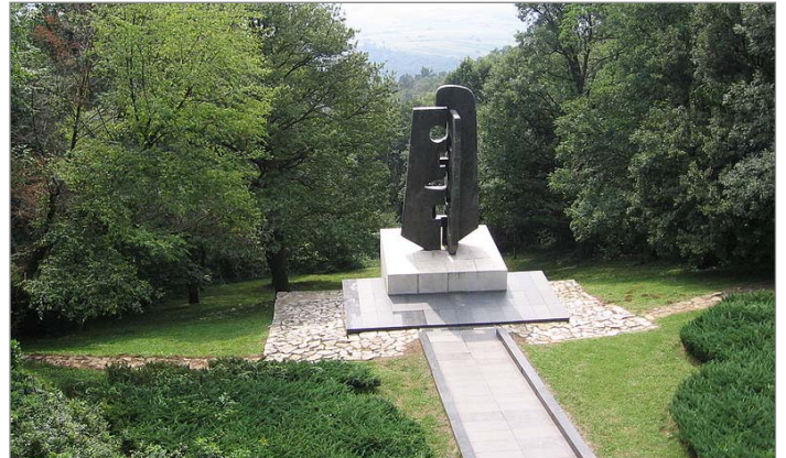
Споменик руским ветеранима на Авали

На месту трагедије на Авали подигнуто је спомен обележје.