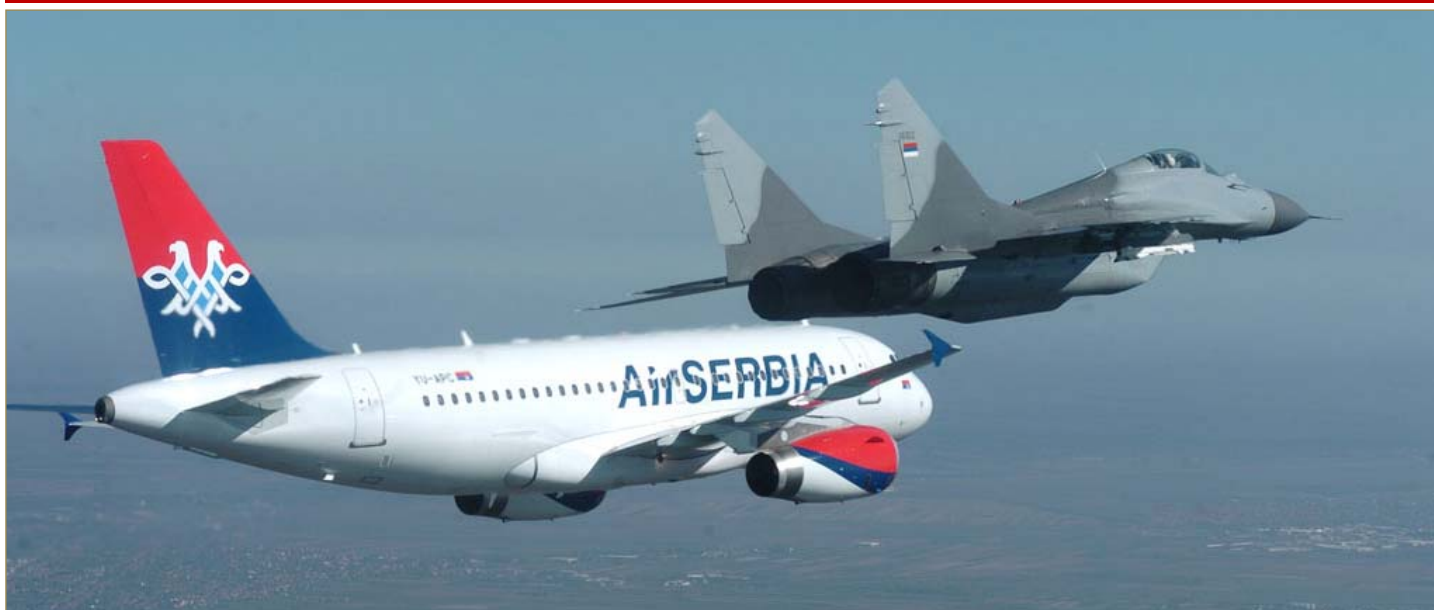
Модерни путнички авион "Ербас А319" домаће компаније "Ер Србија" у пратњи МиГ-29 В и ПВО Војске Србије

Први авион компаније Ер Србија, Ербас А319 слетео је на београдски аеродром "Никола Тесла" у суботу 19. октобра 2013. године. Авион је долетео из Дизелдорфа где је био на фарбању, а кроз српски ваздушни простор допратила су га два војна МиГ-29.