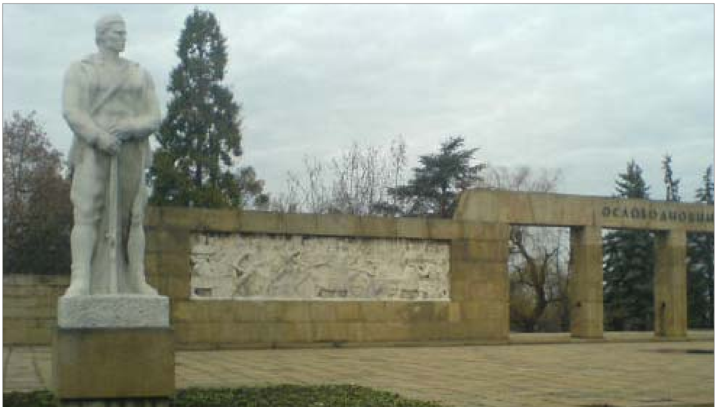
Положени су венци на Спомен гробље ослободиоцима Београда од фашистичке окупације 20. октобра 1944. године