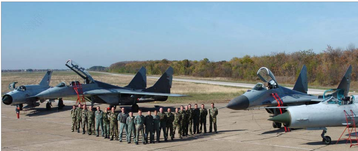
Летачки и ваздухопловнотехнички састав 204. ваздухопловне бригаде који је обезбеђивао први лет авиона "Ер Србије"

На авиону "Ербас" А319 пише "Ер Србија" и беле је боје, са додатим плавим и црвеним детаљима пише "Ер Србија".