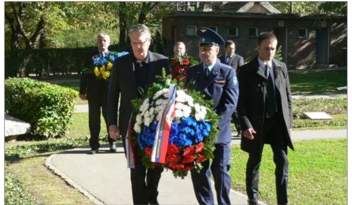
Венац делегације Руске Федерације