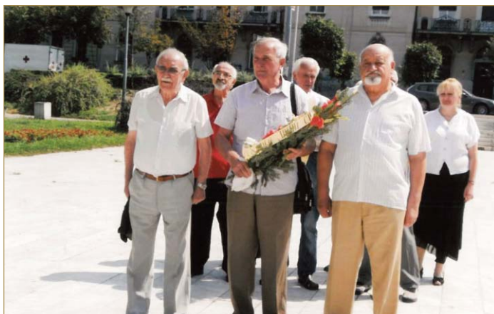
У Земуну су 7. јула представници УПВЛПС и УВПС положили цвеће пред споменик борцима НОР-а и жртвима фашистичке окупације.

Међу присутнима били су и представници УПВЛПС, дајући допринос, са колегама из СУБНОР Земун, обележавају 77 годишњице од почетка општенородног устанака против окупатора и његових слугу у окупираној Србији и (тада) Југославији. (З.Г.)