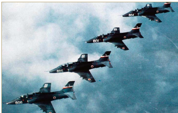
Одељење авиона "Супер Галеб" Г-4 у лету.

Авион Г-4 "Супер Галеб" и данас лети у јединицама РВ и ПВО Војске Србије. (З.Г.)