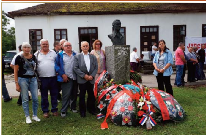
Пред спомеником Жикици Јовановићу Шпанцу у Белој Цркви, након полагања венаца, представници СУБНОР-а и УПВЛПС

Широм Србије обележен је 7. јули Дан устанка против фашистичких окупатора у његових слугу 1941. године. Државна свечаност одржана је у Белој Цркви, питомој варошици у Рађевини, недалеко од Крупња, у меморијалном центру.