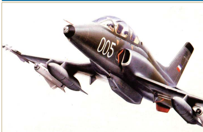
Авион "Супер Галеб" Г-4 може да носи разноврсна убојна средства

Прототип југословенског школско-борбеног авиона Г-4 "Супер Галеб" полетео је 8. јула 1978. године.