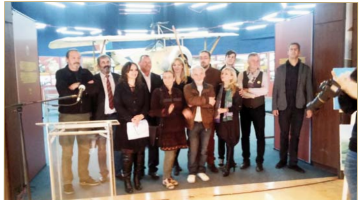
Групни портрет уметника учесника ликовне колоније у Музеју ваздухопловства