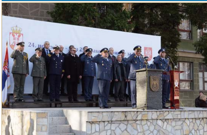
Свечана бина на прослави Дана 250. рбр за ПВД у касарни Бањица у Београду