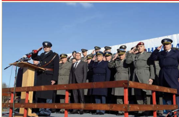
Свечана бина на аеродрому Лађевци - Краљево са највишим званицама на прослави Дана 98. вбр