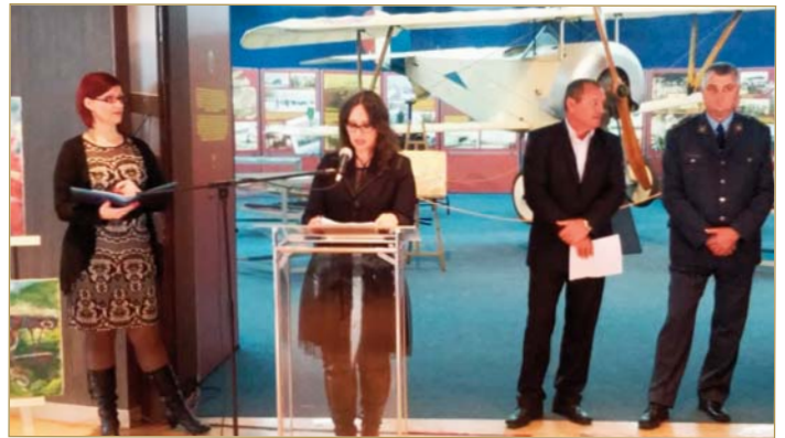
Отварање изложбе (горе) и публика (доле).