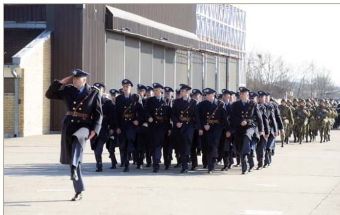
Свечани дефиле припадника 98. ваздухопловне бригаде на прослави Дана јединице 28. новембра 2017. године

Командант 98. ваздухопловне бригаде, пуковник Дејан Васиљевић, подсетио је на богато историјско наслеђе јединице и сумирао њене резултате рада. Дан 98. вбр обележава се у знак сећања на 28. новембар 1949. године, када је формиран 98. лбап. Свечаност је употпунио дефиле јединица 98. ваздухопловне бригаде.