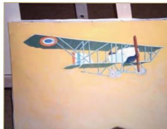
Уметничке импресија авиона на платну