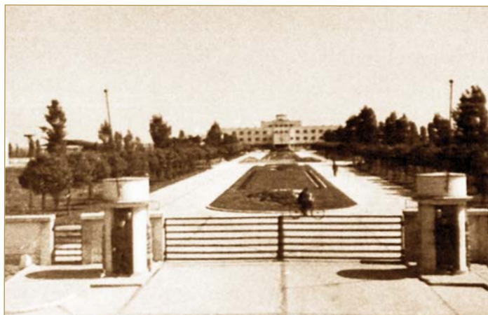
Аеродром Батајница - изглед из педесетих година прошлог века