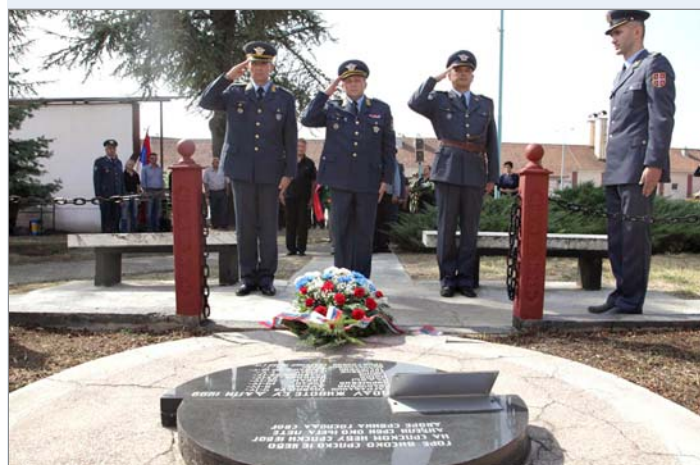
Испред споменика припадницима 250. ракетне бригаде за ПВД који падоше за слободу Отаџбине

Венце на спомен обележје палим припадницима 250. ракетне бригаде који су животе дали за одбрану отаџбине положили су представници команди и јединица, чланови породица, представници ратних састава, локалних градских власти и Српске православне цркве.