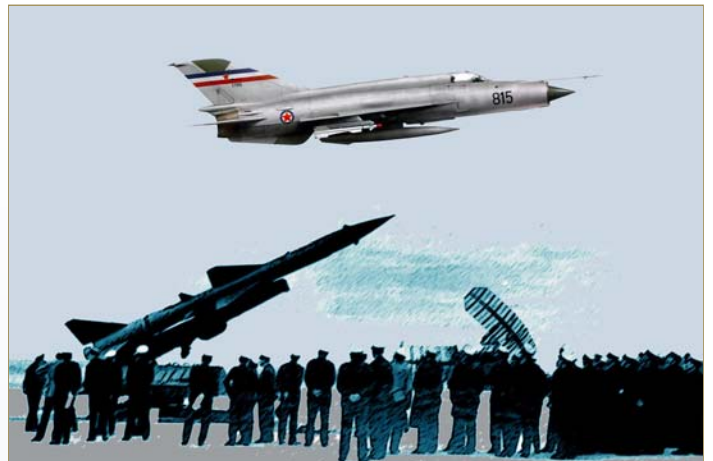
Историјско сећање: 50 година од увођење најасавременијих средстава ПВО: РС "Двина" и суперсоничног ловца МиГ-21