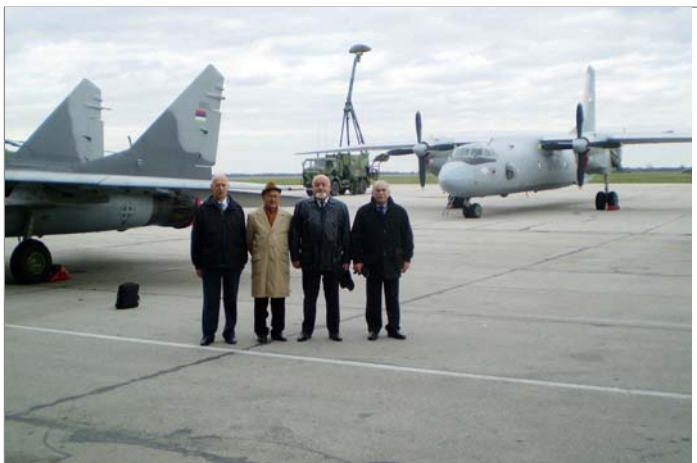
Чланови Удружења пензионисаних војних летача и падобранаца Србије на стајанци аеродрома Батајница

Данас 204. ваздухопловна бригада у свом саставу има ловачке, ловачко-бомбардерске, извиђачке, транспортне и школске авионе, хеликоптере и јединице за логистичку подршку и одбрану аеродрома Батајница.