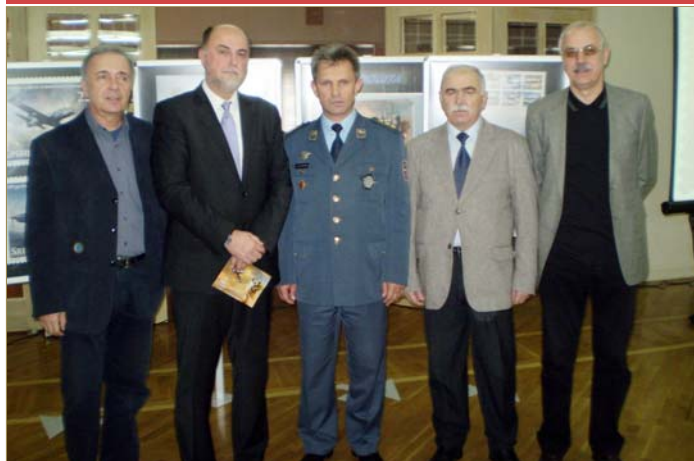
Са промоције пригодних поштанских марака поводом 100. година Српског војног ваздухопловства

У Дому Војске Србије 20. новембра одржана је промоција пригодних поштанских марака и коверата издатих поводом обележавања 100 година српског војног ваздухопловства.