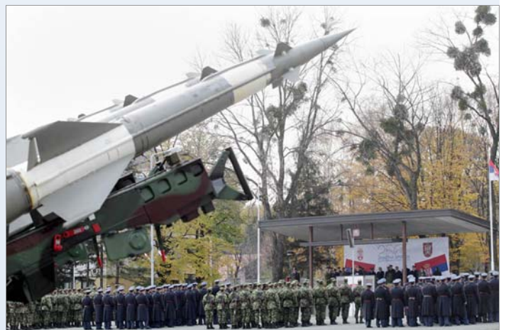
Испред споменика припадницима 250. ракетне бригаде за ПВД који падоше за слободу Отаџбине